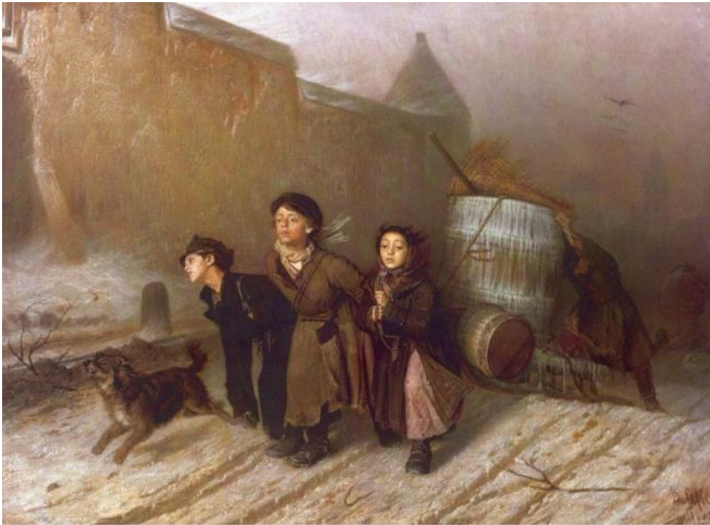
В. Перов. «Тройка»

Выберите из предложенных статей Конвенции о правах ребёнка ту статью, которая нарушена. Ответ укажите цифрой.